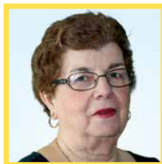
Pauline Tétreault Députée de Debden