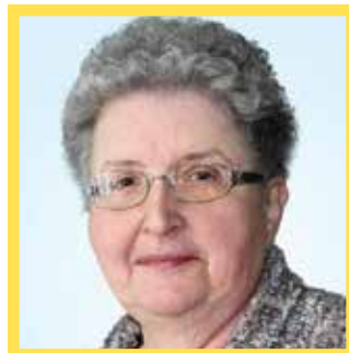
Annette Labelle Députée de Ponteix