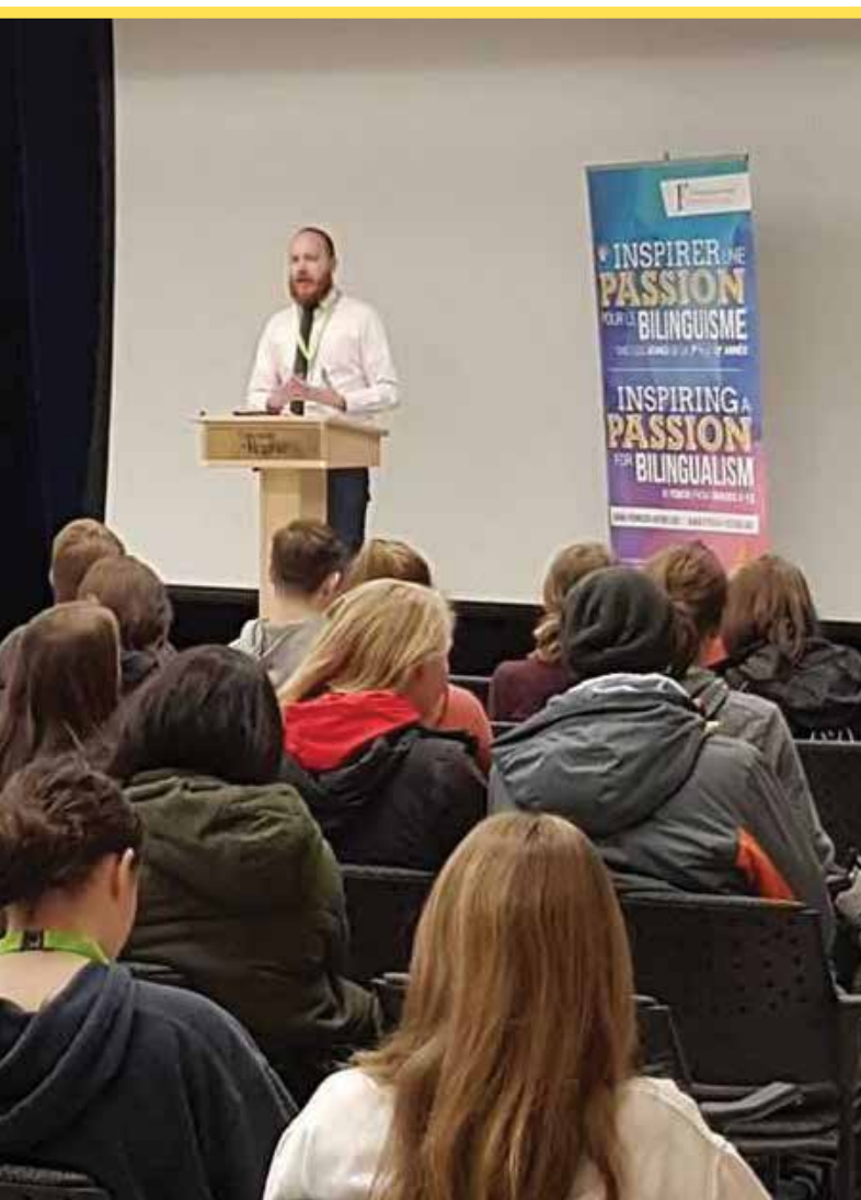
Les élèves de l'école Campbell colligate participent au Forum local du Français pour l'avenir à Regina en février