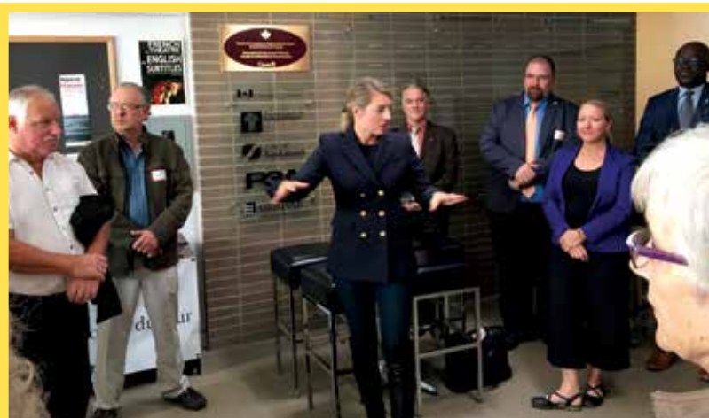
La ministre du Tourisme, des langues officielles et de la francophonie l'Honorable Mélanie Joly, rencontre les organismes fransaskois à Saskatoon.

Le RIF-SK est une table de concertation fondée par l'ACF en 2002. Depuis le 31 mars 2017, le Conseil économique et coopératif de la Saskatchewan est l'organisme fiduciaire du RIF-SK. L'ACF participe, avec les autres membres, à son fonctionnement. Elle est membre du comité de gestion du RIF-SK.