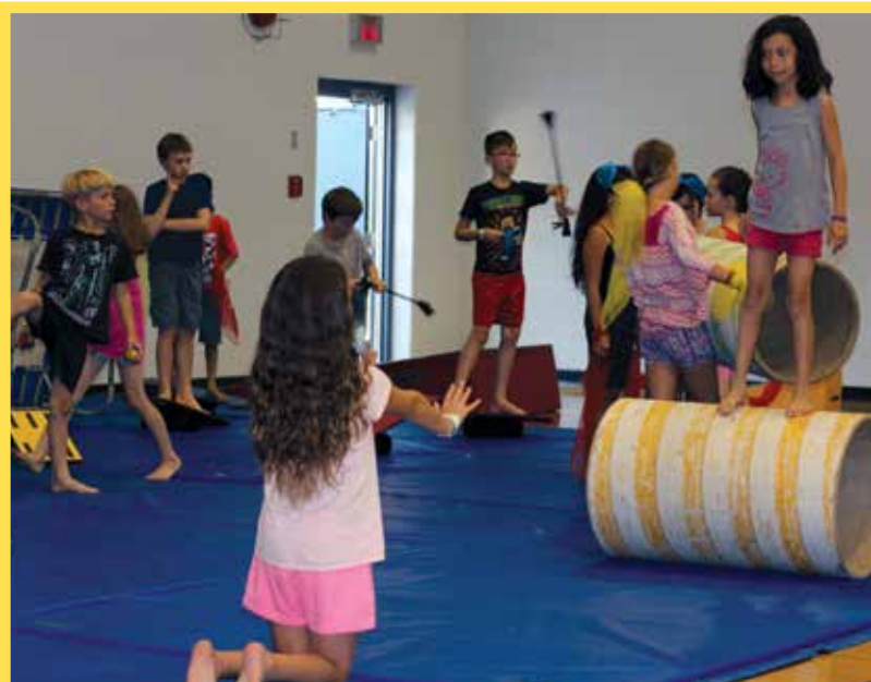
Les participants et participantes apprennent les arts du cirque au Camp voyageur 2018

Un financement sur deux ans (155 000$) a été obtenu en août 2017 pour soutenir le développement d'entreprises d'économie sociale. Cinq associations régionales sont impliquées dans le projet. L'objectif du projet est d'accroître la capacité d'autofinancement de ces associations et