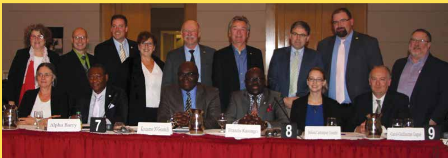
Le Comité permanent sur les langues officielles rencontre des représentant.e.s de la communauté francosaskoise le 27 septembre à Regina.