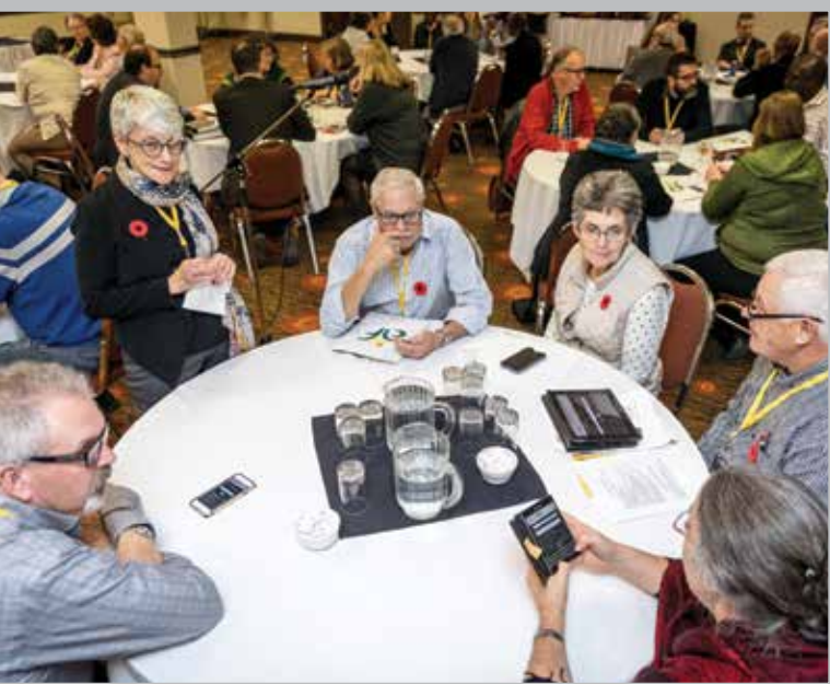
Lors du Rendez-vous fransaskois 2016 à Saskatoon