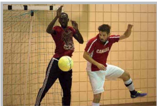
Tournoi fransaskois des nations

Le Camp voyageur a connu une augmentation de 35 % des inscriptions par rapport à l'an 2016 pour atteindre 155 jeunes en 2017.