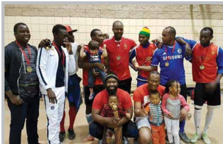
L'équipe sénégalaise gagnante du Tournoi francosaskois des nations