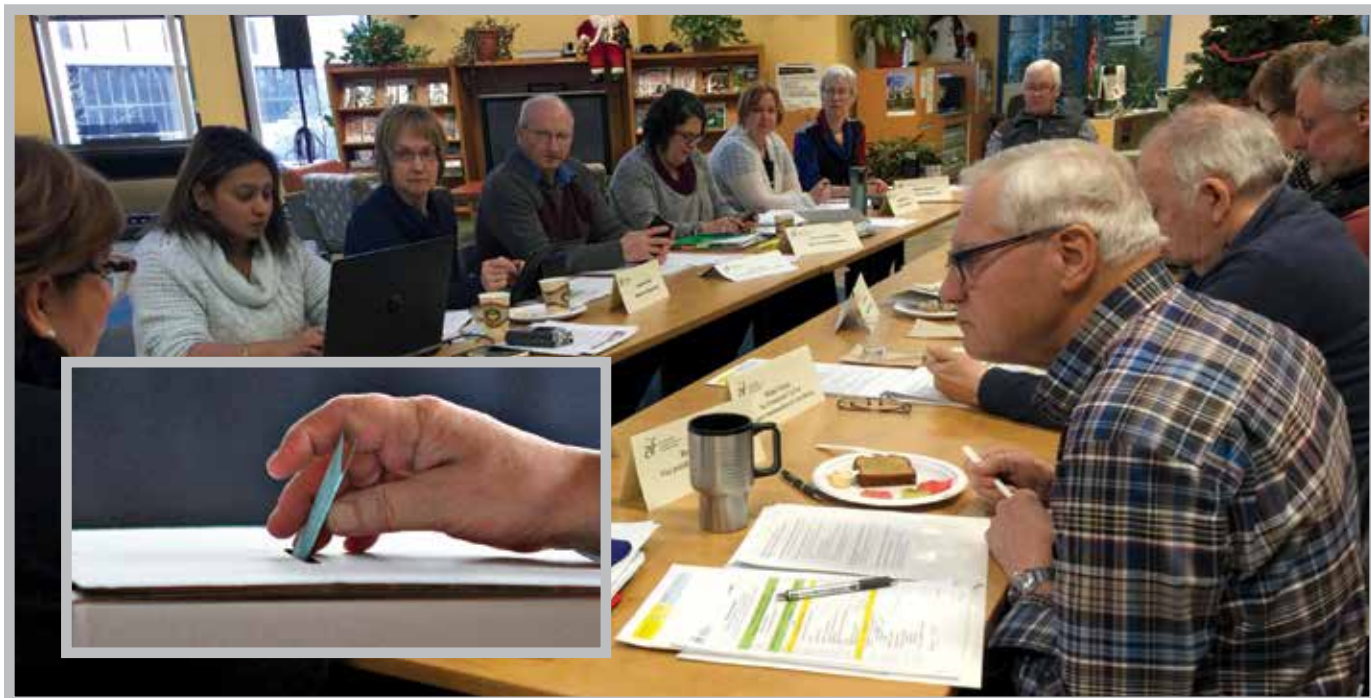
Les députés communautaires en réunion à la Rotonde de la Cité universitaire francophone en décembre 2016

En juin, l'ADC a soumis plusieurs modifications aux Statuts généraux lors d'une Assemblée générale des membres tenue à Prince Albert. L'assemblée a adopté trois articles liés aux élections et à durée des mandats des élus. La durée des mandats des élus étant fixée à trois ans, des élections générales pour les députés et la présidence de l'ACF ont été déclarées en juillet 2017. La date du scrutin était le 1er novembre 2017.