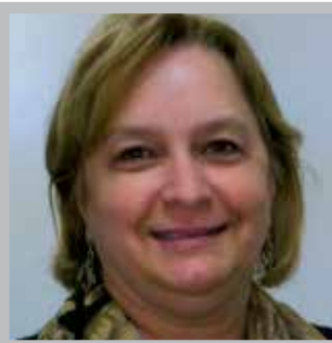
Rachelle Deault Députée de Bellevue