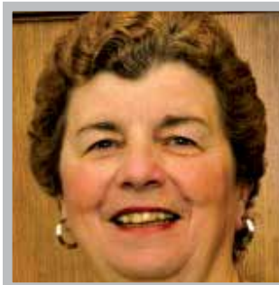
Pauline Tétreault Députée de Debden