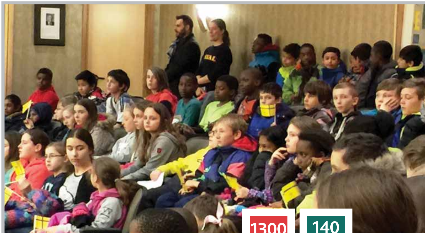
Les élèves de l'École Monseigneur de Laval le 6 mars 2017 à la levée du drapeau à l'Hôtel de ville de Regina