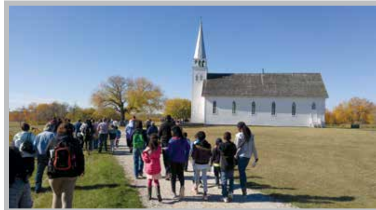
Un groupe de nouveaux arrivants en visite à la Journée du patrimoine à Batoche

Favoriser l'inclusion des nouveaux arrivants au sein de la communauté francophone est une priorité. L'ACF collabore avec plusieurs organismes communautaires pour de nombreuses activités.